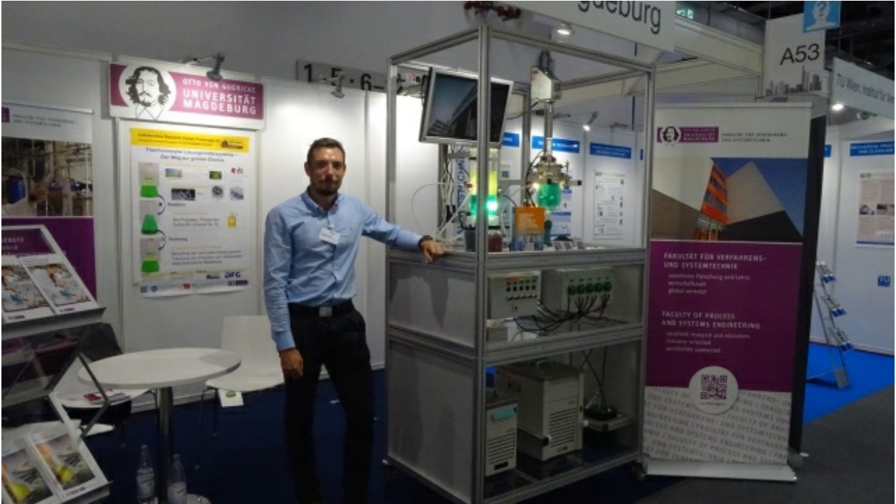
20220825_140930 (Bild 6 von 13) Vorwärts »