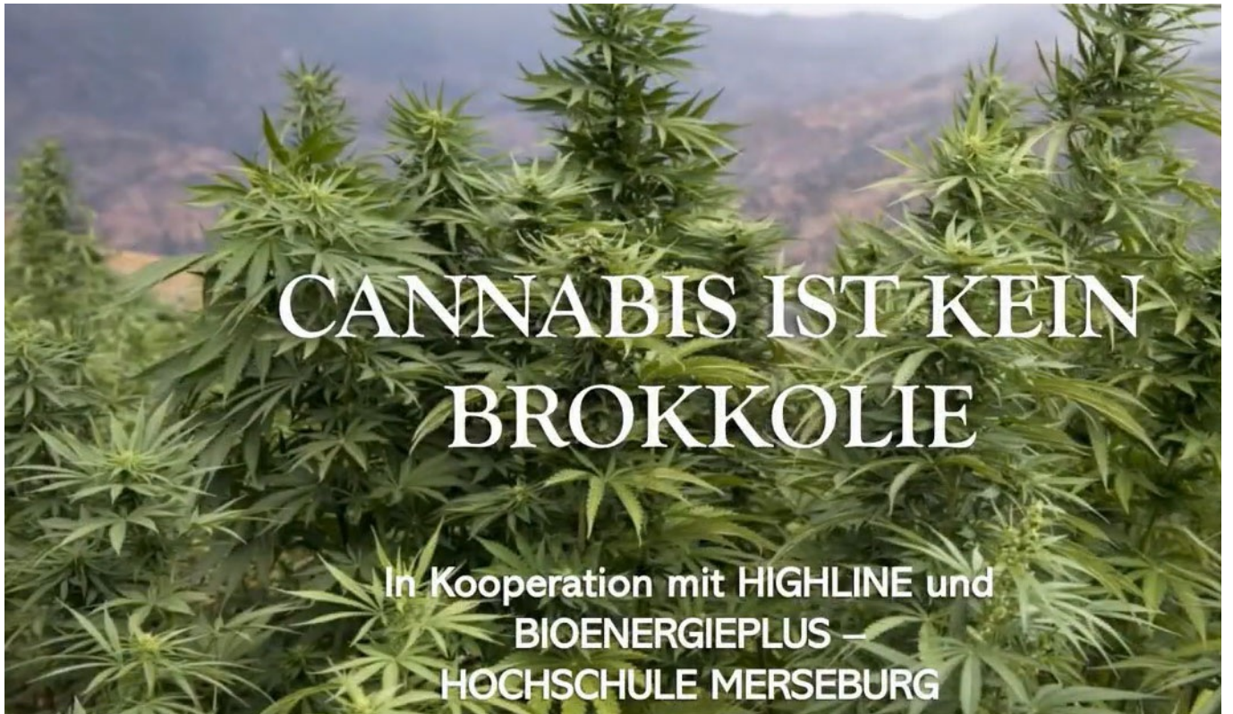
Video: Hanf ist mehr als Gemüse